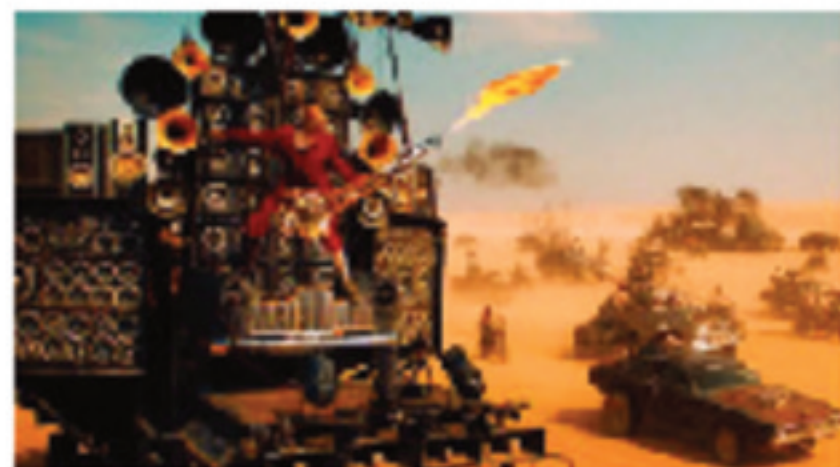
Des décors déliants et déjantés en plein milieu du désert, on est bien dans Mad Max